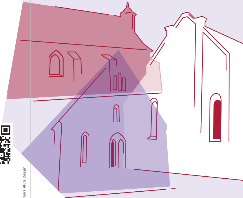
Barbara Klute Design

Regionsbezogene Gebäudebedarfsermittlung